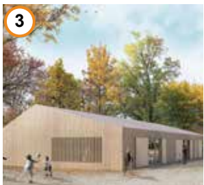
asp telux und kinderfarm

Ziele des 2017-2018 erarbeiteten „Verkehrs- und Freiraumkonzepts Nebenstraßen“ rund um den Brüssler-Kiez sind die Verbesserung von Wege- und Freiraumverbindungen, insbesondere für den Geh- und Radverkehr, um eine bessere Anbindung an die Müllerstraße zu ermöglichen.