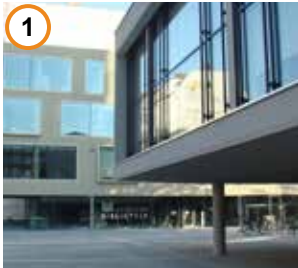
rathausplatz und schiller-bibliothek

Der Rathausplatz ist zentrales Aushängeschild des Ortsteils Wedding. Der Neubau der Schiller-Bibliothek (AV1 Architekten) wurde 2016 fertiggestellt. Im Anschluss konnte mit der Neugestaltung der Platzfläche nach Plänen des Büros ANNABAU begonnen und letztes Jahr mit einer feierlichen Eröffnung abgeschlossen werden. In Erinnerung an Elise und Otto Hampel wurde eine Informationsstelle im Sommer 2018 im Zuge der Neugestaltung des Rathausplatzumfeldes aufgestellt.