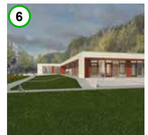
neubau kita edinburger straße

Mit Mitteln des Städtebaulichen Denkmalschutzes wurde das Gebäude barrierefrei umgebaut und ein Stadtteilzentrum integriert, um nachbarschaftliches Engagement zu unterstützen und einen Beitrag zur sozialen und kulturellen Förderung des Stadtteils zu leisten.