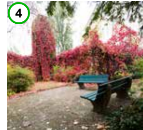
hof- und begrünungsprogramm

Im Aktiven Zentrum und Sanierungsgebiet Müllerstraße werden mit Hilfe eines Begrünungsprogramms Maßnahmen zur Begrünung und Umgestaltung von Innenhöfen, Hausfassaden und weiteren Freiräumen unterstützt. Konzentriert wird sich auf die Gestaltung und Begrünung von privaten Wohn- sowie gewerblichen Höfen, die in einem hohen Maße versiegelt sind und nur geringe Aufenthaltsqualität für Mieter und Nutzer bieten. Ein erstes Projekt ist im Bereich der nördlichen Müllerstraße vorgesehen.