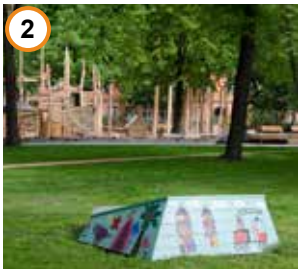
zeppelinplatz und nebenstraßenkonzept

Der Rathausplatz ist zentrales Aushängeschild des Ortsteils Wedding. Der Neubau der Schiller-Bibliothek (AV1 Architekten) wurde 2016 fertiggestellt. Im Anschluss konnte mit der Neugestaltung der Platzfläche nach Plänen des Büros ANNABAU begonnen und letztes Jahr mit einer feierlichen Eröffnung abgeschlossen werden. In Erinnerung an Elise und Otto Hampel wurde eine Informationsstelle im Sommer 2018 im Zuge der Neugestaltung des Rathausplatzumfeldes aufgestellt.